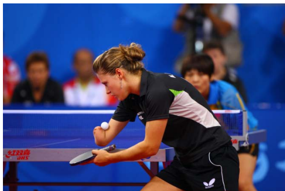
Natalia Partyka, http://www.nataliartyka.pl , Juegos Olímpicos de Beijing 2008

Pero, por supuesto, no es esperable que todos los niños focomélicos de este mundo tengan la fortaleza y oportunidades de Alison Lapper y Natalia Partyka: