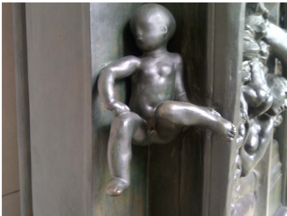
Auguste RODIN, Las puertas del infierno , detalle, 1880-1917; fundición de 1926-1928.

Los lectores de este trabajo podrán discrepar en mayor o menor medida de las interpretaciones de lege lata y de lege ferenda defendidas en él. Cohonestar la libertad civil de formar una familia con una dinámica del derecho de la persona que dé una oportunidad a las personas que, en relación con tal o cual condición médica, se desvían de la pauta, de la normalidad de su cohorte demográfica en menor o mayor medida –en una, dos o más desviaciones estándar- o que lo hacen en una dimensión únicamente física o también en otra psíquica, pero que perciben, que ven, oyen y sienten cada día aquello en que la sociedad valora su ser, no es tarea fácil. Pero creímos al iniciar este trabajo y seguimos creyendo ahora, llegado su final, que el intento de ampliar el radio del círculo de respeto a la humanidad, a las diferencias entre los seres humanos, a la creciente inclusión de las personas en nuestra sociedad y, sobre todo, en la que queremos dejar a nuestros hijos valía la pena. El tiempo juzgará.